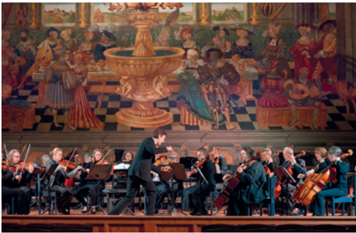
Orchesterfoto: Christian Flamm