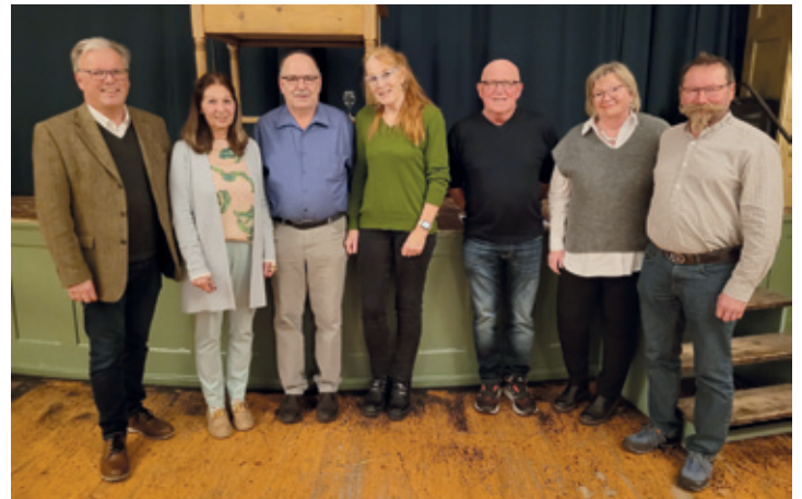
sowie die Rentnerinnen und Rentner