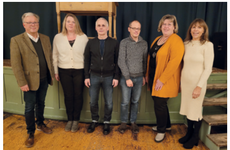
Bei der Feier anwesende Dienstjubilare...