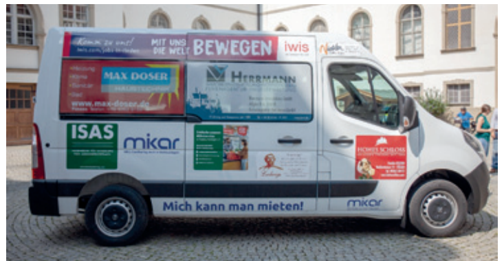
So ähnlich soll der neue CarSharing Bus für Wasserburg aussehen. (Beispielbild: CarSharing Fahrzeug Standort Füssen)

Der Kleinbus kann von allen Wasserburgerinnen und Wasserburgern ausgeliehen werden, z.B. für Transportfahrten oder für Ausflüge. Das ist rund um die Uhr zu preisgünstigen Konditionen möglich. Damit ist Schluss mit Fragen wie: Woher bekommen wir ein Fahrzeug? Passen wir alle rein? Wie bringen wir das ganze Gepäck unter?