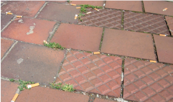
Muss das sein? Überall in Wasserburg liegen Zigarettenkippen auf der Straße. Das schaut nicht nur sehr unschön aus, sondern ist auch ein großes Problem für die Umwelt

Wer seinen Zigarettenstummel einfach auf den Bürgersteig schnippt, riskiert deshalb nicht zu Unrecht ein Verwarngeld. Vor allen Dingen sollte anhand der vorgebrachten Argumente aber von selbst die Erkenntnis reifen, dass Zigarettenstummel in den Aschenbecher und nicht auf die Straße oder in die Natur gehören.